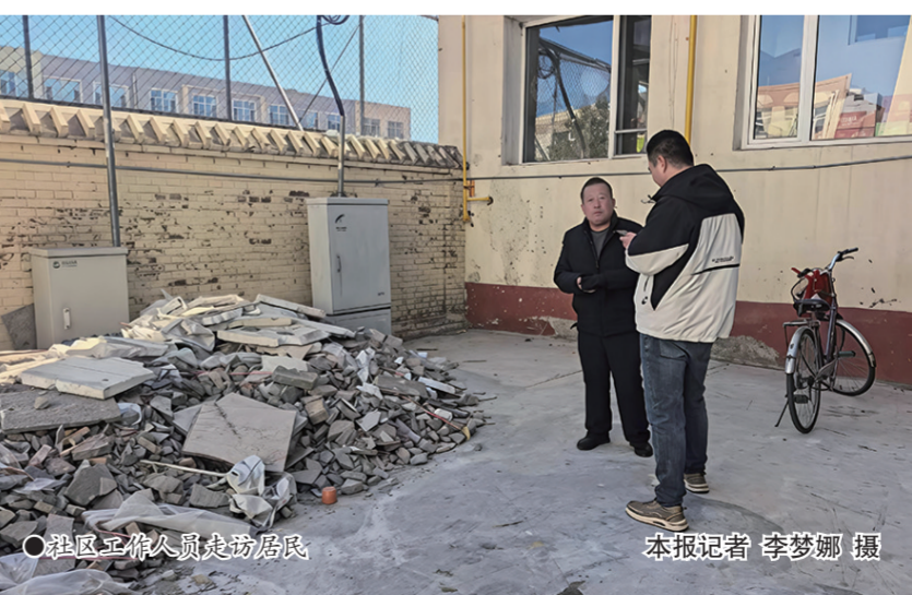
○社区工作人员走访居民

本报讯(记者 李梦娜)近日,集宁区前进路街道解放社区开展环境卫生集中整治专项行动,聚焦辖区内建筑垃圾乱堆乱放、卫生死角垃圾等群众反映集中的突出问题,开展精细化清理整治,切实改善辖区人居环境,把民生实事落到实处。 解放社区内老旧小区较多,部分无物业小区长期存在杂物乱堆、垃圾积存的问题。在安居小区、二家中家属楼等区域的背街小巷、单元楼角落,存在装修砖石、水泥块、废旧家具随意堆放的情况,不仅占用公共空间和消防通道,影响居民正常通行,还易产生扬尘、积存污渍,存在环境卫生和消防安全隐患。“走路得绕着走,看着心里也不舒服”,成为不少居民的普遍感受。为切实解