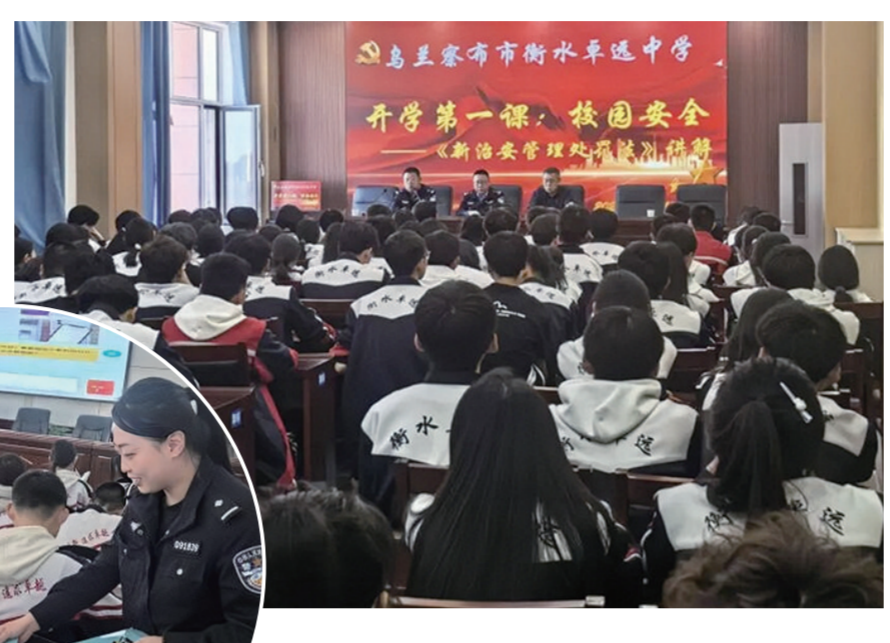
▲市公安局集宁分局积极开展普法进校园活动 ▲工作人员发放宣传资料

直观的认识。不少学生也提到,通过现场演练,掌握了基础的应急避险方法,心里更有底了。 随后,宣传团队走进衡水卓远中学。马莲渠派出所民辅警围绕新修订的《中华人民共和国治安管理处罚法》,用通俗易懂的语言解读未成年人年龄分级处罚、校园欺凌治理、未成年人特殊保护及监护人责任等内容。通过情景模拟、以案释法的方式,结合青少年身边典型案例,讲解未成年人自我保护、远离违法犯罪行为的实用方法,明确网络空间并非法外之地。同时,民辅警还重点普及禁毒常识、毒品识别技巧,拆解游戏充值诈骗、冒充好友借钱、刷单返利等常见诈骗手法,以及交通安全、用火用电安全等日常安全知识,全方位提升学生自我防护能力。 “民警用我们身边的案例讲法律,比课本上的条文好懂多了。”衡水卓远中学学生张明说,活动让他明白,在网络上也要规范言行,不能触碰法律底线。还有学生表示,学到