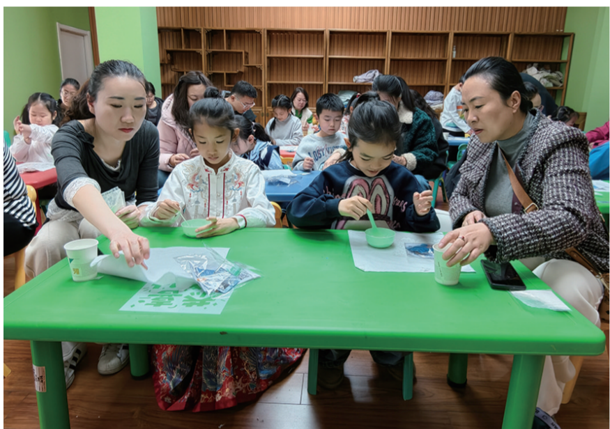
●家长与孩子将粉末材料搅拌成糊状

“举办这次活动,一方面是想让孩子们近距离接触国家级非遗项目灰缬——蓝印花布印染技艺,了解传统工艺的魅力,另一方面也希望通过‘龙元素’主题,让孩子们感悟草原文化与中华优秀传统文化的交融,增强文化认同感和自豪感。”乌兰察布市博物馆工作人员表示,下一步将持续推出更多非遗体验、文物探秘类的亲子活动,让乌兰察布市博物馆成为孩子们的“第二课堂”,让非遗文化在传承中焕发新生,让更多家庭在互动中感受文化的力量。