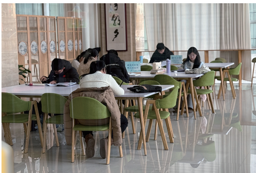
●市民尽享阅读时光