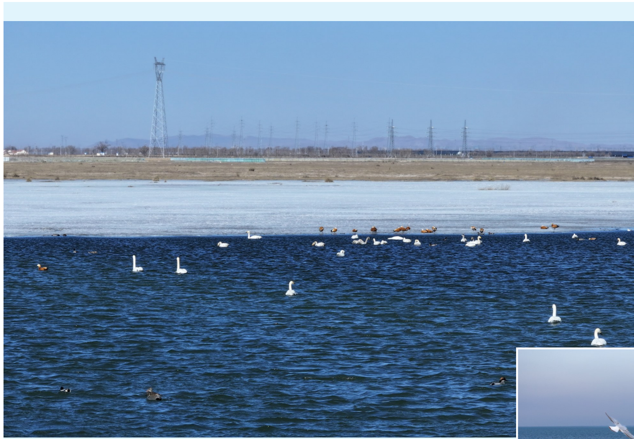
▲成群结队的天鹅来到察汗泽尔湿地湖面觅食栖息。