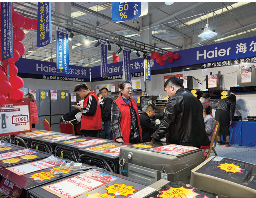
●家博会现场,市民挑选家电