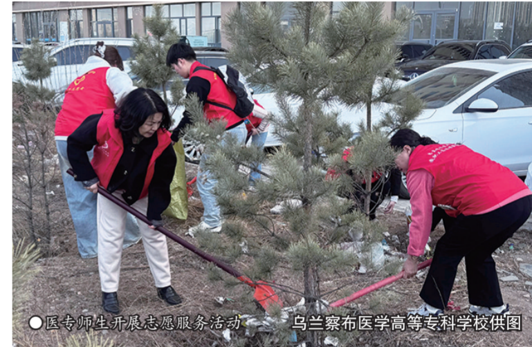
●医专师生开展志愿服务活动