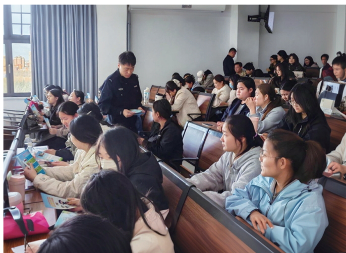
●民警给学生发放禁毒手册

本报讯(记者 李梦娜)为切实加强青少年毒品预防教育,筑牢校园禁毒安全防线,近日,集宁公安分局禁毒大队民警走进乌兰察布市高等医学专科学校,开展以“护航无悔青春,防范青少年药物滥用”为主题的禁毒预防教育专题讲座,通过形式丰富的宣传教育,帮助师生掌握禁毒知识,提升识毒、防毒、拒毒能力。