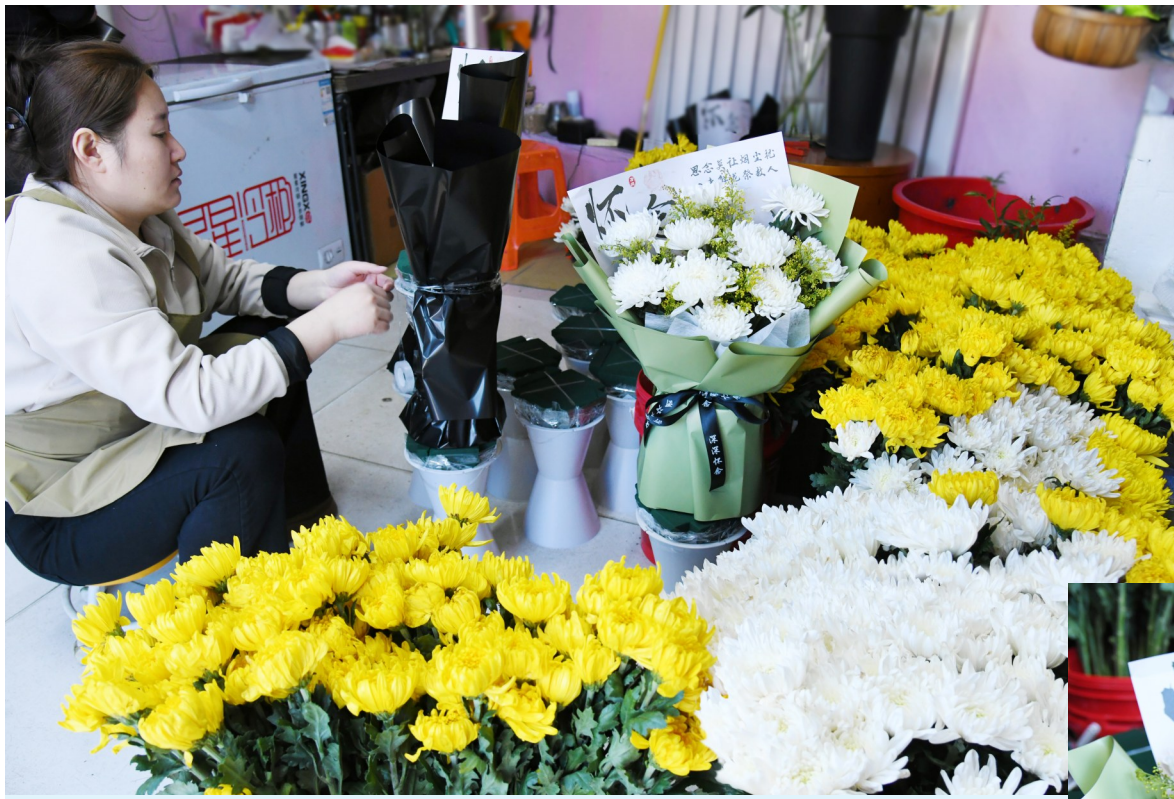
▲店员正在赶制订单。

化德县人民医院相关负责人表示，目前，“百场健康宣教公益行”活动已累计开展27场，服务群众近万人次。通过深入基层、贴近群众，不仅让老百姓享受到便捷优质的医疗服务，也有效提升了基层医疗机构的服务能力，实现了“输血”与“造血”相结合。下一步，医院将继续发挥专业优势，整合优质医疗资源，常态化开展健康宣教和义诊活动，用实际行动守护群众健康，为建设健康化德贡献力量，让更多基层群众享受到医疗改革发展的成果。