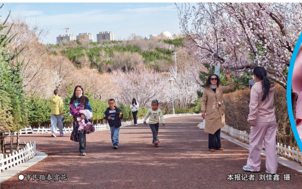
市民踏青赏花

本报讯(记者 刘佳鑫)4月12日,随着气温持续回升,乌兰察布市桃花、杏花等各色花卉绽放,旖旎春光吸引众多市民走出家门踏青赏花,尽享美好春光。