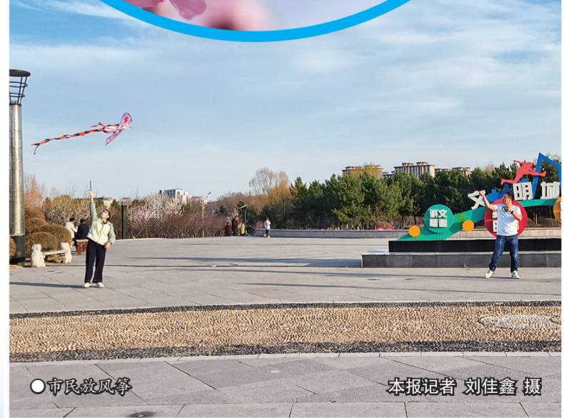
市民放风筝