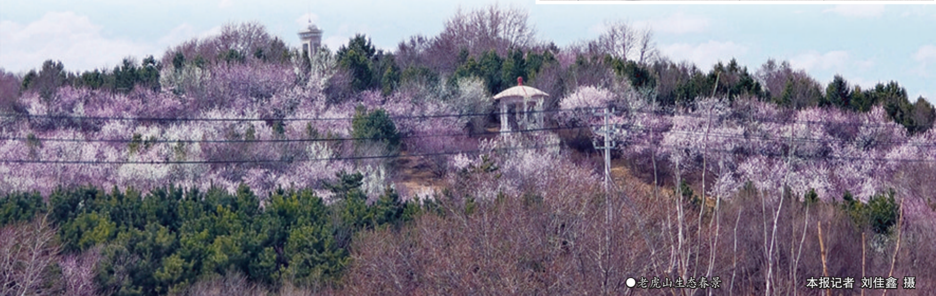
老虎山生态春景