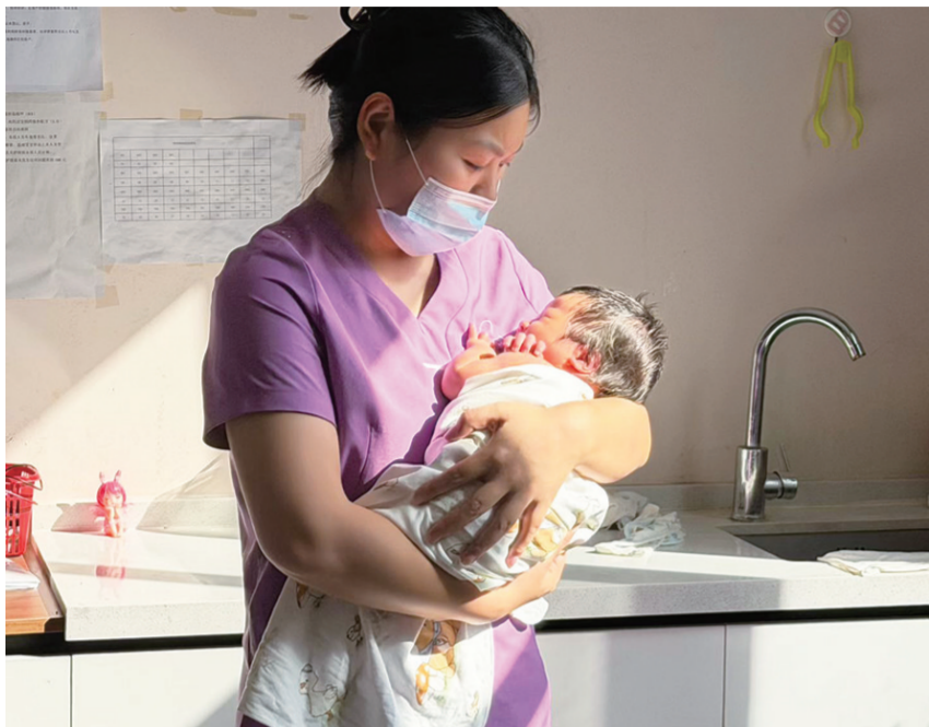
母婴师照顾宝宝