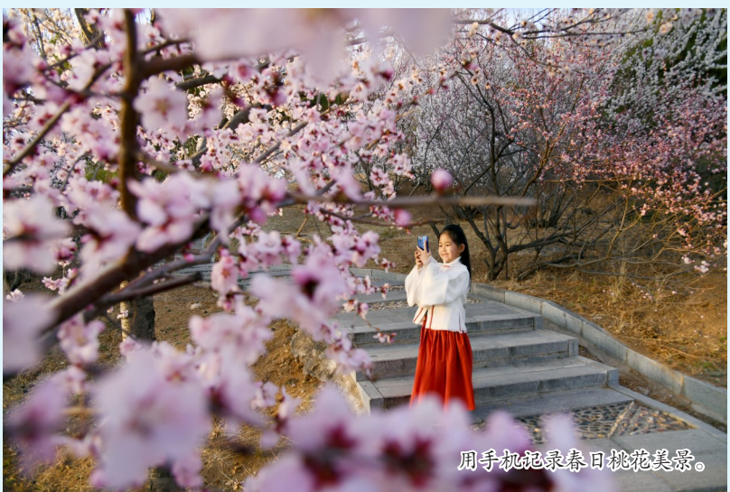
用手机记录春日桃花美景。