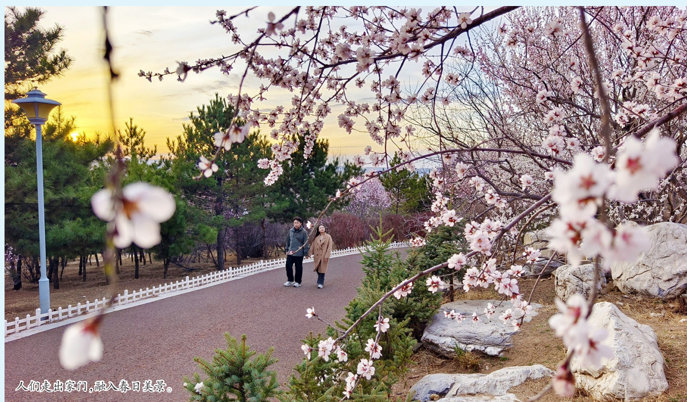
人们走出家门，融入春日美景。

连日来，中心城区街道旁，山桃花次第绽放，粉白相间的花朵缀满枝头，为春日增添了一抹温柔亮色。