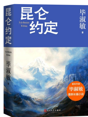
►《昆仑约定》 ►毕淑敏 著 ►人民文学出版社

小说以西京文化研究院的住房分配为主线,生动描绘了不同群体的曲折故事,展现了一幅关乎精神栖息和物质追求的悲喜剧。