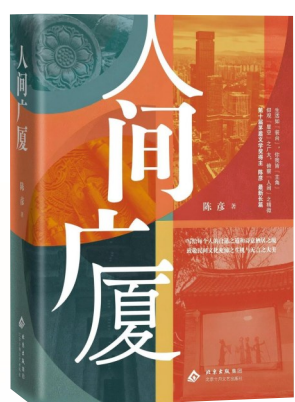
►《人间广厦》 ►陈彦 著 ►北京十月文艺出版社

小说以西京文化研究院的住房分配为主线,生动描绘了不同群体的曲折故事,展现了一幅关乎精神栖息和物质追求的悲喜剧。